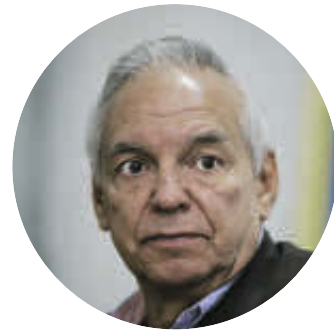
RICARDO BONILLA Ministro de Hacienda

Expuso que para el segundo semestre hay expectativas de recuperación y están apalancadas en buena medida por la adición presupuestal de $16,9 billones que aprobó el Congreso, recursos que se destinarán al estímulo de la economía local con base en actividades como la construcción de obras públicas y vivienda.