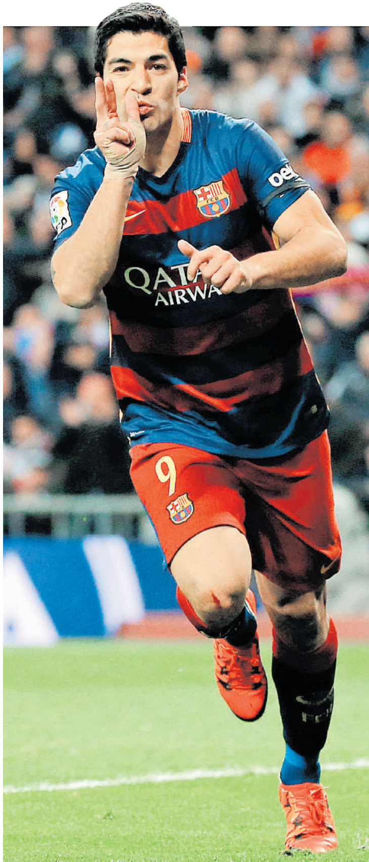
El uruguayo Luis Suárez lleva anotados seis goles en Champions League, tras siete encuentros disputados.