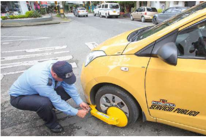
Durante el pasado mes, 194 vehículos mal estacionados fueron sancionados con este sistema.